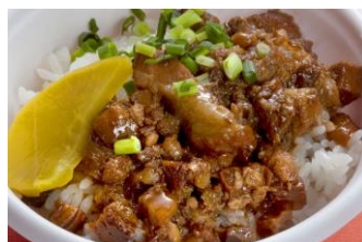
△魯肉飯（ルーローファン）