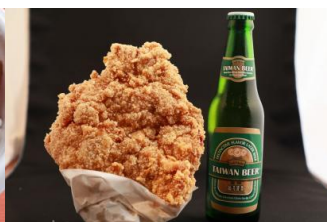
△大鷄排（ダージーパイ）